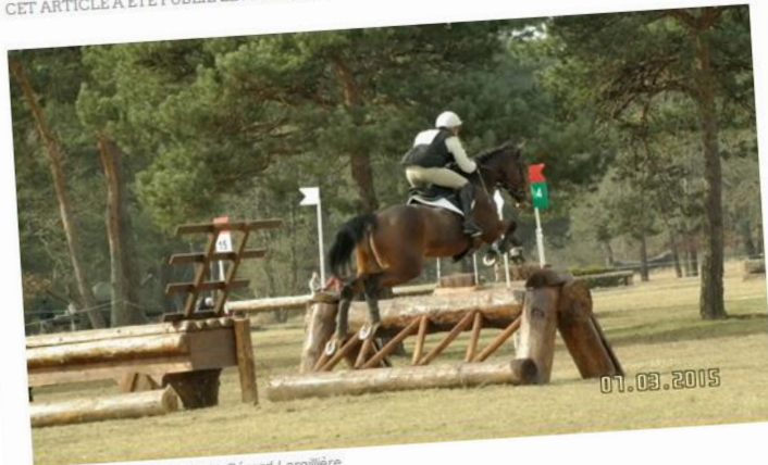
Fontainebleau 2015

Le week-end à Fontainebleau a été bien rempli pour les organisateurs du CSEM. Depuis jeudi, 13 épreuves à suivre et ça continue aujourd'hui et demain avec les jeunes chevaux, soit 531 engagés au total !